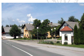
Ponikve - vaško jedro

At the crossroads in Rašca, birthplace of Primož Trubar, consolidator of the Slovene language, there is a signpost pointing to Dobrepolje; after following it for two kilometres one reaches the partially elongated and partially clustered settlement of Ponikve. The settlement is situated 4 km to the north-west of the centre of the municipality, in the broad valley of the Rašca disappearing stream. This picturesque watercourse in the immediate vicinity of the village vanishes from the surface and enters a mysterious and unknown subterranean world of Dobrepolje and the Suha Krajina karst.