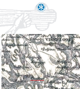
Zemljevid Petra Kozlerja - detajl Ponikve