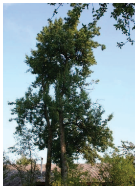
Tepka na Somrakovem vrtu