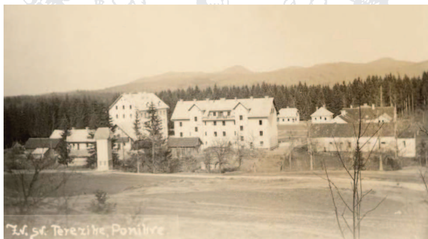
Dom Sv. Terezike

The third part of Ponikve village is represented by the former iron smelter and later also the Institute of St. Therese and the Social Welfare Institute in Ponikve. The iron smelting works were opened in 1855 and the foundations of the St. Therese Institute were laid in