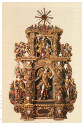
Oltar Sv. Mihaela