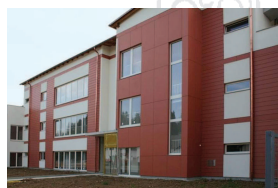
Dom Sv. Terezike