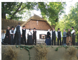
Folklorna skupina iz Ponikev