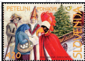
Znamka Pošte Slovenije, 2006