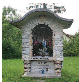
Kamnita kapelica Zavoda