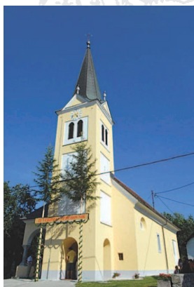
Cerkev Sv. Florjana